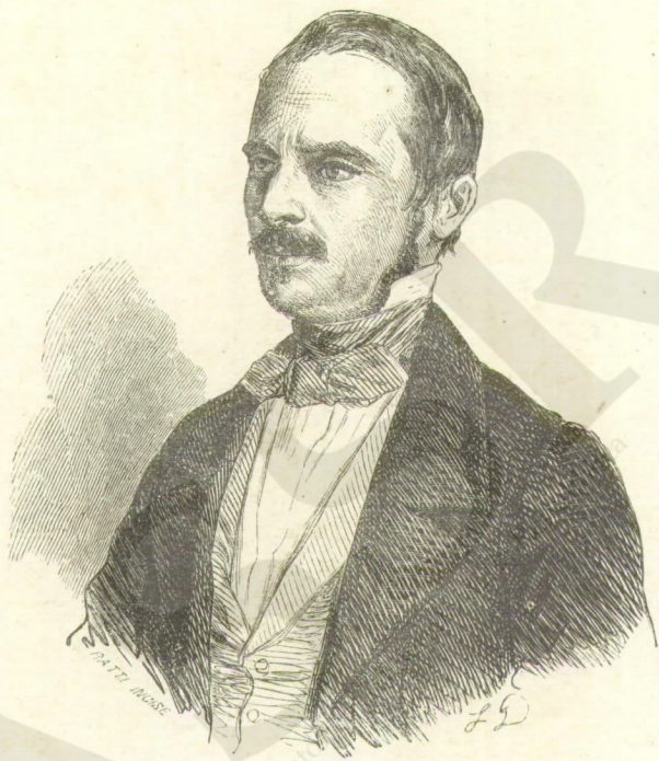
Archivio storico Urbano Rattazzi. 4